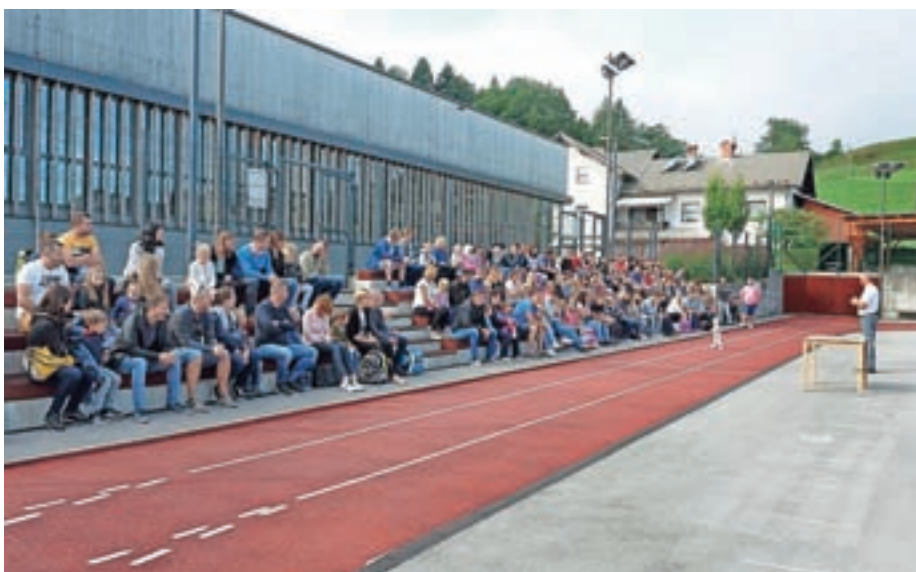
Sprejem otrok v prvi razred pred šolo v Gorenji vasi

Učenci od 1. do 9. razreda so prejeli šolsko publikacijo, v kateri lahko poiščejo marsikatero informacijo za šolsko leto 2021/22. Dnevi dejavnosti so načrtovani kot v letih pred izbruhom epidemije: plavalna in smučarska šola, bivanje v Centrih šolskih in obšolskih dejavnosti, ekskurzije in ogledi kulturnih prireditev. Šola je vključena v različne projekte, učenci se bodo lahko vpisali v zanimive interesne dejavnosti in se pripravljali na tekmovanja. Pouk je v prvem tednu potekal po modelu B (ko bo članek izšel, bo mogoče že drugače). V šolo imajo vstop starejši od 15 let, če izpolnjujejo pogoj PCT. Pozornost je treba posvečati umivanju, razkuževanju rok in prezračevanju. Obrazne maske so predpisane za vse zaposlene in učence od 6. do 9.