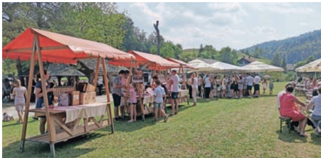
Na Hotavljah so se letos vaščani že tradicionalno družili ob semanjem dnevu na Šinkovcovem travniku.