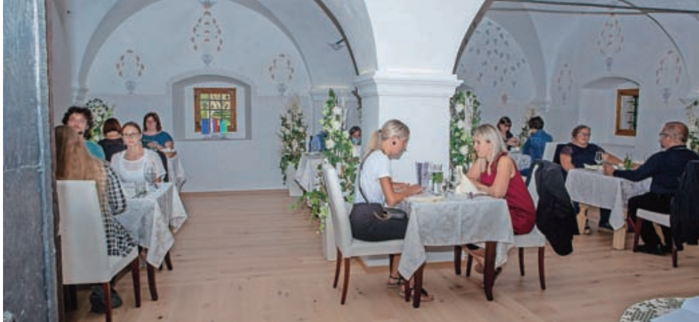
Kulinarni večer na Visokem