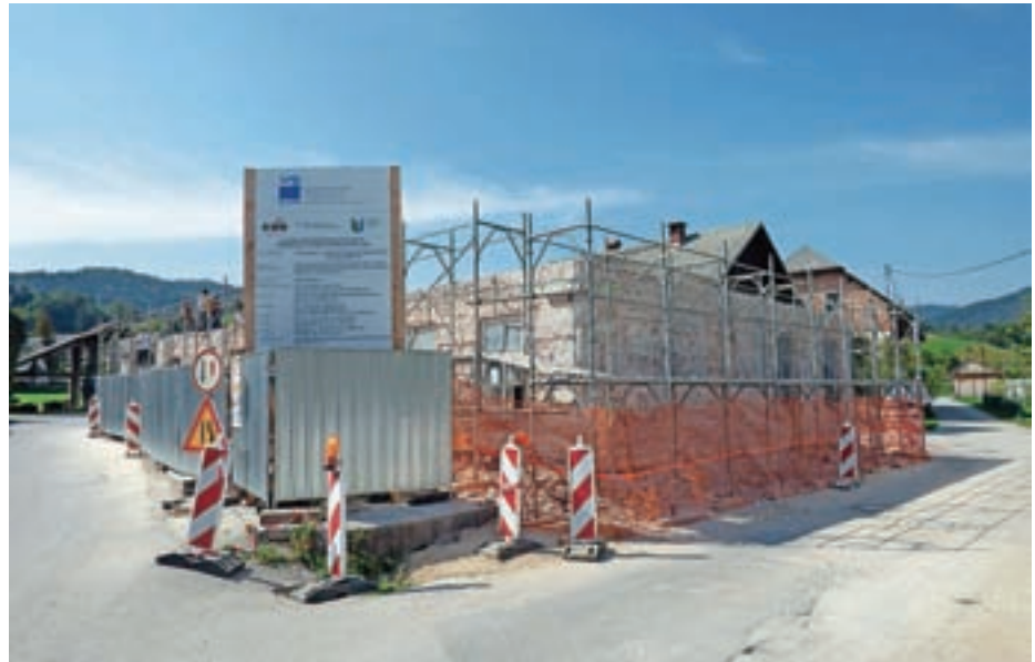
V juliju so začeli rušiti staro šolo, v kateri bo po obnovi že prihodnje leto Hiša generacij.

Do septembra je izvajalec že opravil "injektiranje kamnitih zidov pritličja, odkop kletnih zidov, podbetoniranje temeljev, hidroizolacijo in toplotno izolacijo vkopanih zidov ter drenažo in zasip tako saniranih kletnih zidov". Na vprašanje, ali bodo dela tekla v skladu s predvidenimi finančnimi vložki ali so morda rušitvena dela razkrila še kakšen dodaten vložek, pa Strel odgovarja: "Pri rekonstrukcijah starih objektov je treba neprestano tehtati med posameznimi odločitvami, kaj je boljše, cenejše, primernejše, uporabnejše ... – in tudi v tem primeru je tako. Po temeljitem premisleku in po strokovni presoji statika smo odstranili stene nadstropja, za katere je bilo predvideno, da ostanejo. Razlog pa je bil v statični nestabilnosti, razpokanosti sten in odločitvi, da je boljša in cenejša