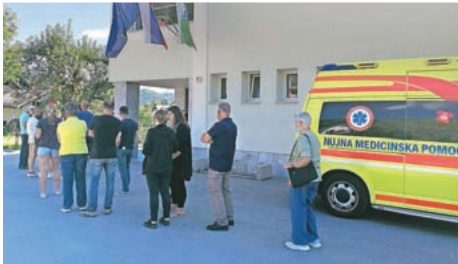
Odziv na odprto cepljenje v Gorenji vasi je bil velik.

K cepljenju bodo spodbujali tako kot doslej. "Zdravniki nagovarjajo paciente, ko pridejo v ambulanto, vsakič, ko imamo