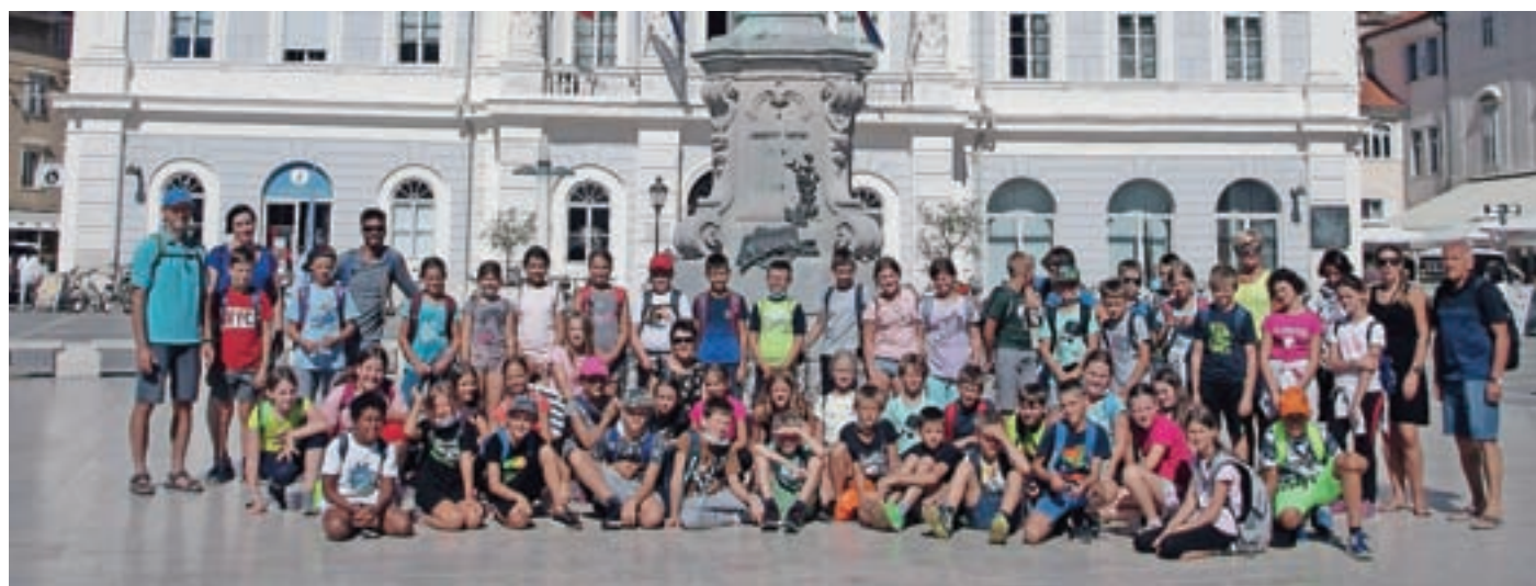
Petošolci v Piranu