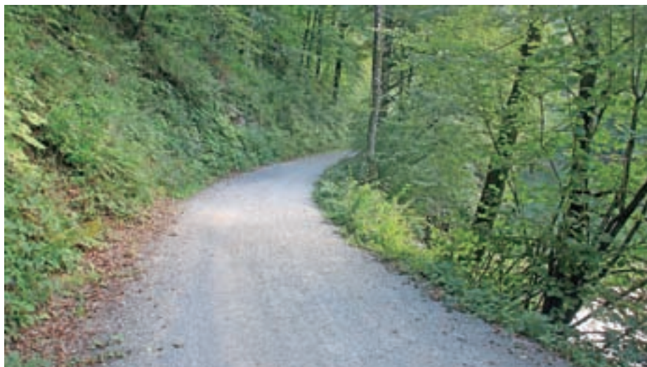
Makadamska pot med Visokim in Hotovljo