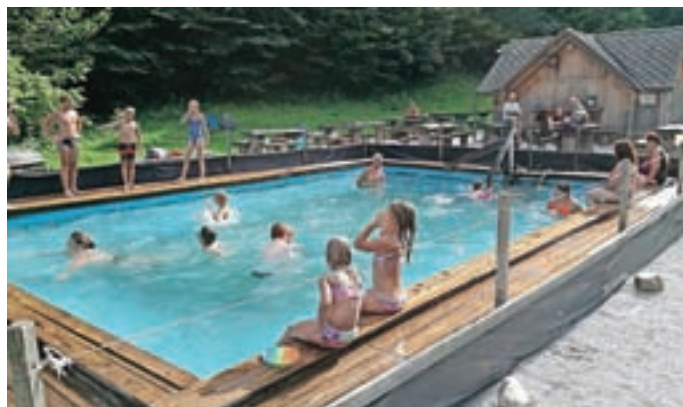
Že tretje leto za red in čistočo na bazenu v Kopačnici skrbi skupina domačinov prostovoljcev.

Kako je potekala letošnja sezona? Reči smemo, da kar uspešno, saj je to naravno danost zdravilne termalne vode uporabljalo veliko domačinov in tudi obiskovalcev od drugod, celo tujcev. Ker je voda primerna za pitje, se nekateri odžejajo kar ob bazenu, drugi jo dnevno nosijo domov. V začetku sezone nam je v brunarici in garderobi najprej skrbi povzročila mišja mrzlica. S primernimi sredstvi in skrbjo za čistočo smo težavo odpravili. Odstranili smo koše za smeti, v katerih so pogosto ostanke hrane in drugi odpadki. Pohvaliti moramo obiskovalce, ki so odpadke in embalažo odnašali domov. Proti sršenom in osam smo uporabili primerna sredstva, da ni prišlo do težav. Strojno čiščenje bazena ni bilo možno (premajhen pritisk vode), zato je bilo treba tedensko prijeti za krtače, bazen izprazniti, očistiti in čez noč napolniti. Tudi obiskovalci so radi pomagali. Druga težava pa se je letos pojavila s hišnimi ljubljenci. Ob vhodu