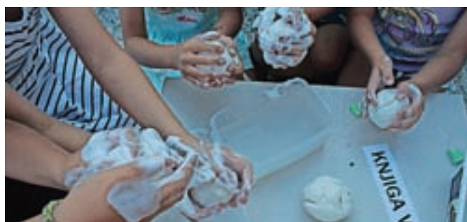
Druženje ob pravljичnem ognjišču

Seveda upamo, da bo vse potekalo po načrtih. Se pa zavedamo epidemiološke situacije in vas zato prosimo, da za natančnejši program sproti spremljate našo spletno stran in Facebook.