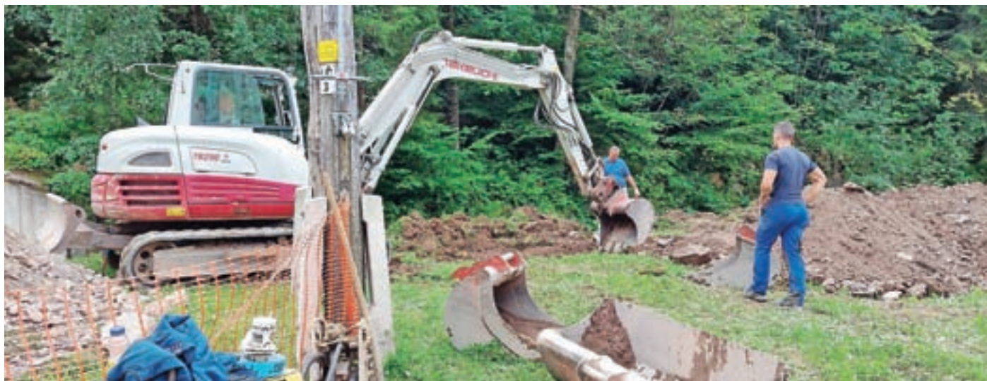
Junija se je začela gradnja dveh novih vodovodnih sistemov v občini.

Strel poudarja, da bo prihodnje leto na vseh gradbiščih še zelo naporno in zahtevno, ter dodaja: "Predvsem si želim, da bi oba izvajalca svoje delo opravila strokovno in kakovostno." Če bo vse teklo po načrtih, bodo proti koncu prihodnjega leta krajanje Lučin in okoliških vasi končno dobili kakovostno oskrbo s pitno vodo. Za dela na vodovodu Vršaj–Brda pa si na občini želijo, da bi se ob malenkostni pospešitvi zaključila kar se da hitro v letu 2023.