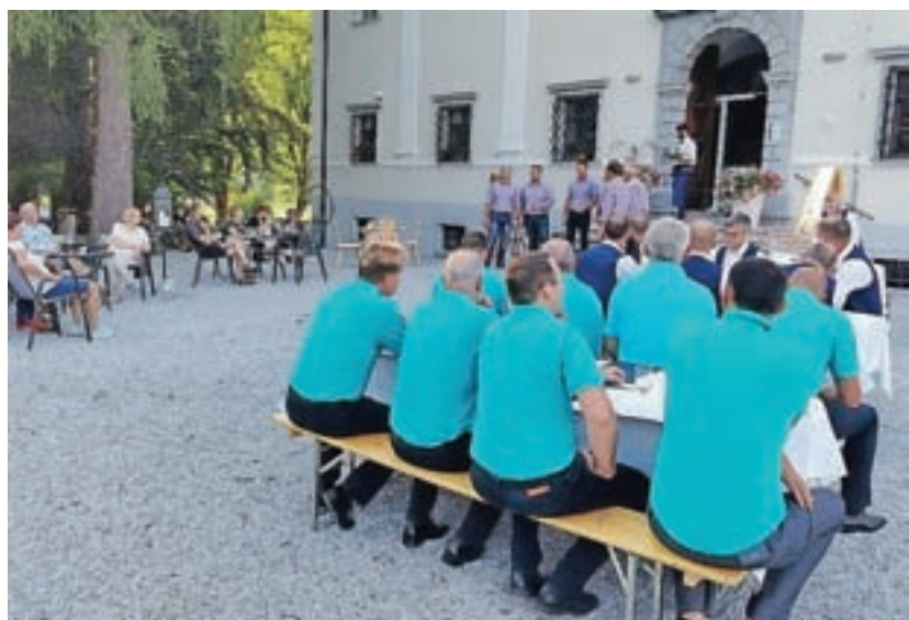
Večer pevskih skupin

V Dvorcu Visoko, Šubičevi hiši in pred Info točko v Gorenji vasi so potekale redne predstavitve lokalnih akterjev. Predstavljali