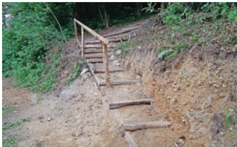
Urejanje poti po grebenu na Bevkov vrh

Bojan Šifrar, ki je eden od trojice članov strokovnega odbora za usposabljanje pri PZS, je pohvalil motiviranost tečajnikov za učenje in urejanje poti pod strokovnim vodstvom mentorjev Igorja Mlakarja iz PD Bovec in Zdravka Bodlaja iz PD Kamnik.