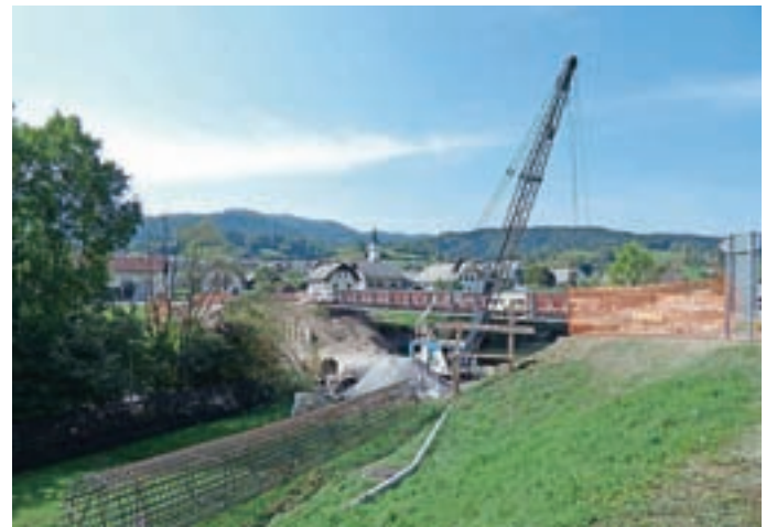
V Gorenji vasi so začeli graditi nov most.

Za izvajalca je direkcija za infrastrukturo na razpisu izbrala podjetje Mapri iz Ljubljane. Po pogodbi, ki so jo konec maja podpisali z izbranim izvajalcem, bodo dela vredna dobrih devetsto tisoč evrov. Začasna prometna ureditev bo veljala vse do izgradnje novega mostu, ki bo končan predvidoma konec marca prihodnje leto. Gre namreč za zelo zahtevno in obsežno gradnjo, so ob tem še dodali na občini.