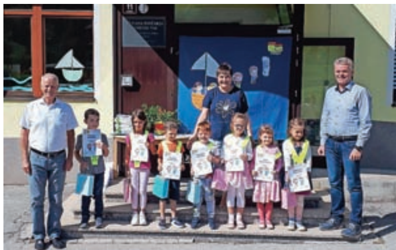
Sprejem prvošolcev na PŠ Lučine