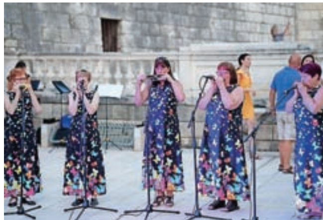
Z nastopa v Zadru

zanost naših pesmi z vsebino svoje razstave in to vpletel v predstavitev.