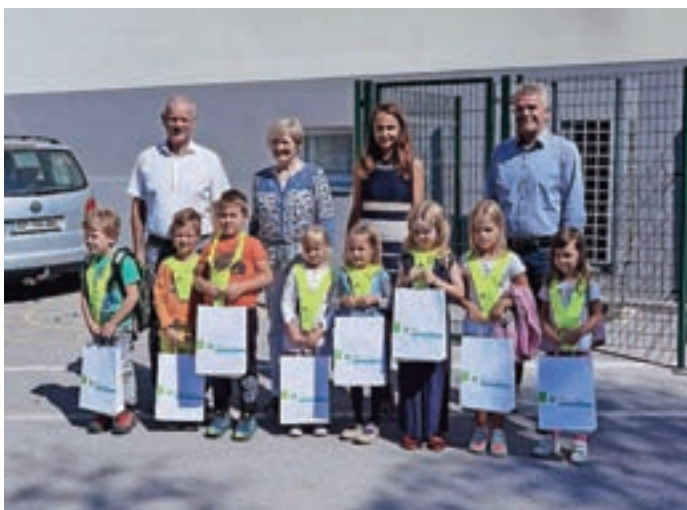
Prvošolci na PŠ Sovodenj

praznovala 50. rojstni dan. Za počastitev jubileja pripravljajo zbornik. Letos pa bi lahko proslavili še več okroglih obletnic: mineva 50 let od ustanovitve Šolskega športnega društva Blegoš, ki se je pred 30 leti preimenovalo v Športno društvo Blegoš; 28. avgusta bi bil Ivan Tavčar, po katerem šola nosi ime, star 170 let; letos slavimo tudi 30 let obstoja naše države. V šoli upajo, da bo pouk celo leto potekal v šoli, da bo čim manj karantenskih odločb za posameznike in oddelke, da bodo čim bolj zdravi in kos zadanim nalogam. Trudili se bodo delati vse za dobro otrok, ki so vpisani v šolo, staršev, zaposlenih, občine in širše skupnosti.